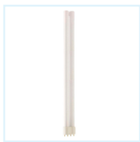
Philips PL-L 36W (2G11)