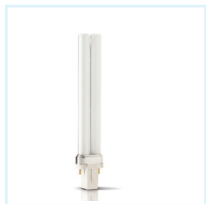
Philips PL-S 9W (G23)

Los estudios clínicos en todo el mundo indican que las lámparas UV de Philips son las más efectivas. Actualmente disponibles para el tratamiento de Psoriasis y Vitiligo, así como para otra enfermedades de la piel menos comunes. Como el mayor fabricante mundial de productos de iluminación, Philips ha aplicado sus conocimientos y experiencia para diseñar una amplia gama de lámparas de fototerapia altamente efectivas. Estas han sido desarrolladas y probadas en estrecha cooperación con universidades y clínicas de todo el mundo.