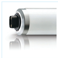
Philips TL RDC (R17d)