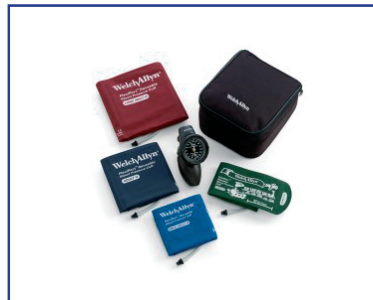
Manguitos de presión arterial