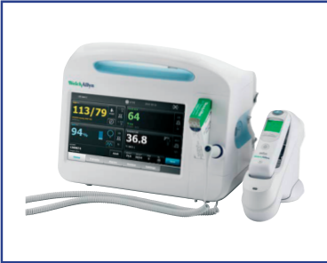
Integrado en los monitores de constantes vitales