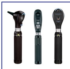
Otoscopios, Oftalmoscopios y Retinoscopios