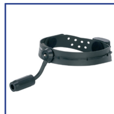
Espejos y Luces Frontales