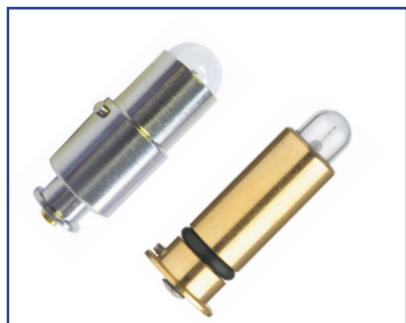
Lámparas halógenas y LED.