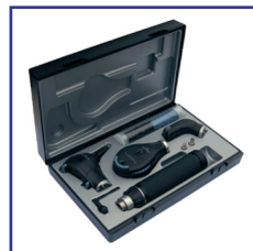
Kit Completo de Diagnostico