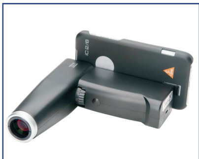
HEINE Funduscopio iC2