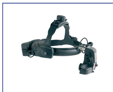
HEINE Oftalmoscopio Indirecto OMEGA500