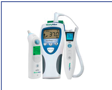
Completa gama de termómetros clínicos