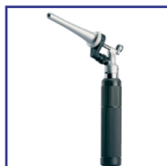
Instrumentos para Otorrinolaringología Veterinaria