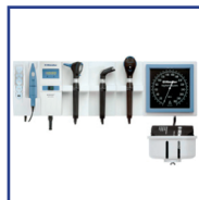
Instrumentos para Otorrinolaringología y Dermatología