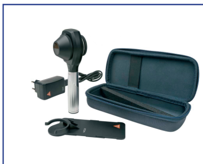
HEINE Kit Oftalmoscopio