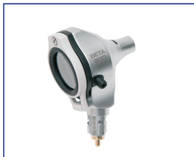
Equipamiento de diagnóstico de montaje en pared