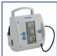
Medidores Presión Arterial