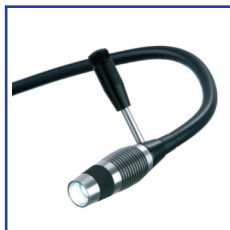
Luces LED para Exploración