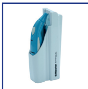
Aparatos para Diagnóstico de Estancamiento de la sangre y Transfusiones