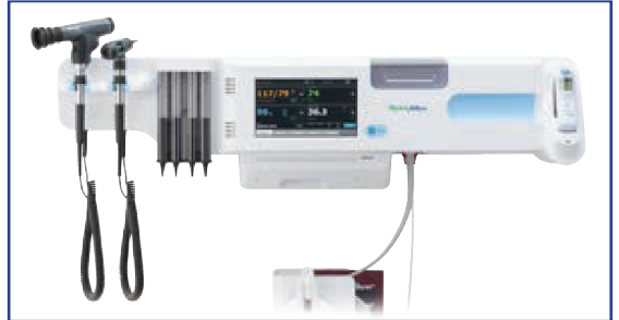
Sistema Integrado de pared