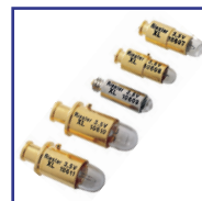
Lámparas halógenas & LED