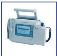
Aparatos para Diagnósticos y Monitorización de Pacientes