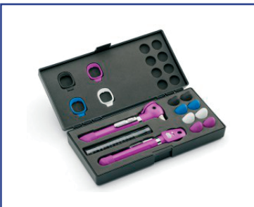
Kit Completo de Diagnostico