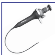
Endoscopios para Otorrinolaringología